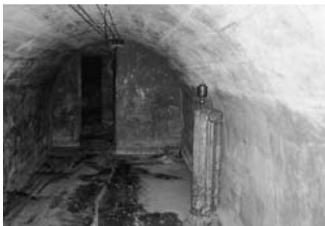
Il rifugio antiaereo di Via Medagli.

progettuali – nuovi appuntamenti musicali, mostre, rassegne cinematografiche, animazioni di strada e teatrali, esposizioni di oggetti del collezionismo e dell'artigianato locale e, visto il successo riscontrato in questi ultimi anni della "sala prove musicale", porremo particolare attenzione alla preparazione di iniziative volte a creare occasioni di incontro e di aggregazione della fascia più giovane di età.