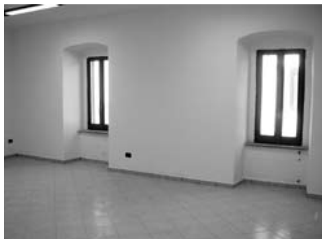
I nuovi locali dell'Archivio Storico Comunale.

Il riordino e l'inventariazione dell'Archivio Storico Comunale, annesso alla Biblioteca, è giunto alle fasi conclusive, nei primi mesi del 2007 si provvederà al suo trasferimento nei locali del secondo piano posti di fronte al palazzo comunale riattati all'uso nel corso dello scorso anno. È allo studio la pubblicazione di una ricerca storica, frutto del nuovo riordino e delle raccolte più antiche, e dell'inventario generale.