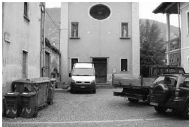
Piazza S. Antonio.

Si procederà alla realizzazione di un passaggio pedonale tra la Piazza Libertà e Piazza della Pace per decongestionare il centro dalla sosta prolungata, partiranno i lavori della "circonvallazione nord Vaie - Sant'Antonino" e si dovrà rivedere la viabilità nel tratto tra la nuova rotonda