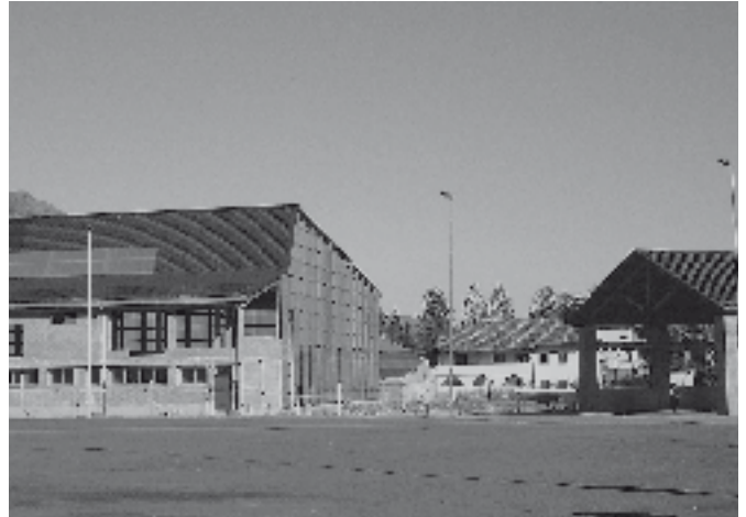
L'area dove sorgerà il 2° lotto dei lavori.

Con il nuovo anno sarà possibile accedere alla prima versione del sito web comunale in forma completa e professionale in osservanza delle normative vigenti in materia di accessibilità, con numerosi servizi ed informazioni on line a disposizione dei cittadini. È stato inoltre definito il progetto per la realizzazione di una infrastruttura wireless per la connettività veloce in grado di fornire servizi informatici e internet alle scuole, alle associazioni interessate e ad eventuali sedi distaccate comunali. Inoltre, tale rete,