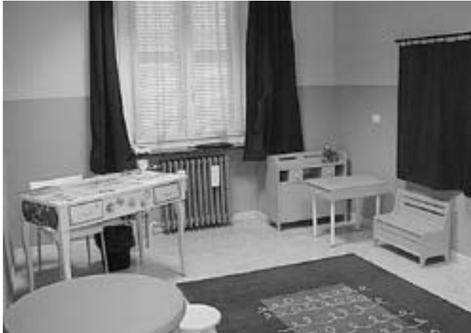
I nuovi locali dell'ASL 5 alla ex palestra della Savara.

a disposizione dei servizi di psicologia del Distretto Sanitario dell'ASL 5 spazi ampi, belli e funzionali con un ricavo in affitto di € 9.000 annui.