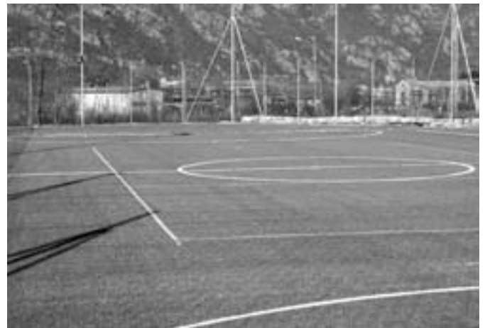
Il nuovo campo da calcetto del Codrei.

Ovviamente l'Amministrazione Comunale collaborerà con le varie Associazioni del paese e del territorio per le iniziative sportive - giochi della gioventù, pro-Bessen, tornei - e la manutenzione degli impianti.